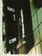
IDAX pour les mesures d'humidité et de TAN DELTA des enroulements