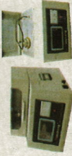
Analyseur de facteur de dissipation et tangente delta de l'huile