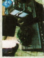
DELTA 4000 pour les mesures de TAN DELTA des bornes et du transformateur