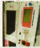
Analyseur de rigidité diélectrique ou tension de claquage