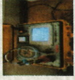
Analyseur chromatographique des gaz dissous