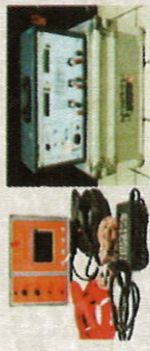
Milli-ohmmètre pour les mesures de résistances des enroulements