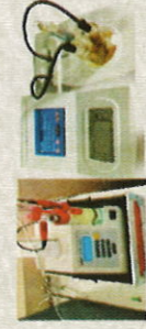
Karl Fisher pour les analyses de teneur en eau