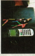
Ratiomètre monophasé pour mesures de rapport