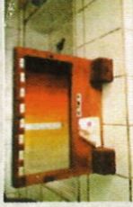
Tableau pour la coloremétrie